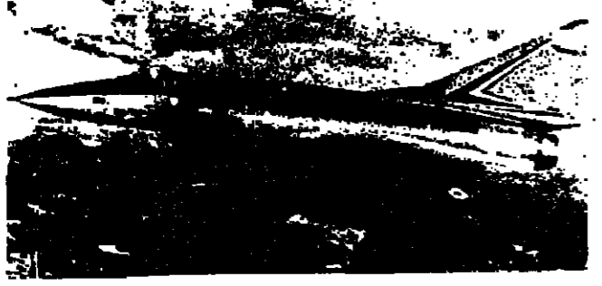
الميراج ٤٠٠٠ لصواريخ القند

والواقع ان باريس تعتبر هذا السلاح واحدا من تلك «المائلة الرهيبه» التي قد لا تستعمل على الاطلاق لكنها تعطي تميرا فخريا - سياسيا - للدولة الملتزمة دون ان يعني هذا ان بإمكانه الحل محل اسلحة اخرى ، بل انه يساهم بصورة فعالة في تشكيل « الجراب النووي » على اي هجوم محتمل .